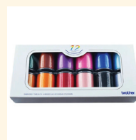
ENSEMBLE DE 12 FILS DE BRODERIE DE COULEUR SAETTS