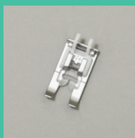
PIED POUR MONOGRAMME N+ SA216