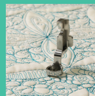
PIED POUR RÈGLE À TIGE HAUTE SA218