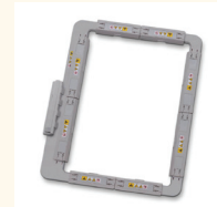
CADRE MAGNÉTIQUE DE 7 PO X 12 PO SAMF300