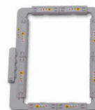
CADRE MAGNÉTIQUE DE 7 PO X 12 PO SAMF300