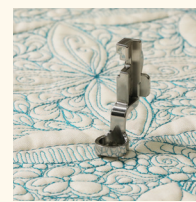
PIED POUR RÈGLE À TIGE HAUTE SA218